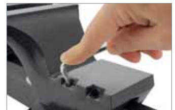
Nachstellbare Führungen für spielfreien Lauf.