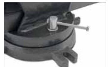
Drehteller leicht fixier- und demontierbar.