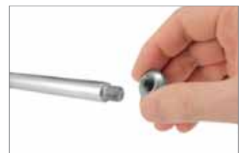
Einfache Demontage des Stahlarms.