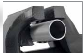
Mit integriertem Rohrspanner unterhalb der Backen.

Der Klassiker für jede Werkstatt: Vollständig aus hochwertigem Stahl geschmiedeter Parallelschraubstock mit induktionsgehärteten und geschliffenen Backen mit gefrästen Zähnen. Großer, gehärteter Amboss . Gewalztes, zweigängiges Trapezgewinde für präzise und schnelle Bedienung. Integrierte Rohrspannbacken . Gegen Verschmutzung und Beschädigung geschützte Spindellagerung. Spannweite höher als Backenbreite für mehr Komfort. Lieferung mit 360°-Drehteller .