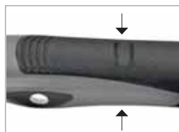
Korrekte Handhabung durch beidseitige Fingermulden.