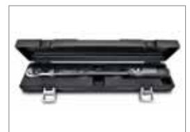
Dauerhaft geschützt in hochwertiger Transportbox.