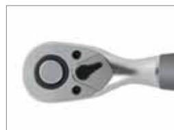
Fest integrierte Qualitätsknarre, extra schmale Kopfform.