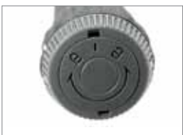
Einfache Ver- und Entriegelung am Griffende.

Warum kompliziert machen, wenn es auch einfach geht.