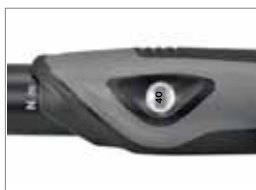
Eindeutiger, numerischer Einstellwert, keine Strichskala.